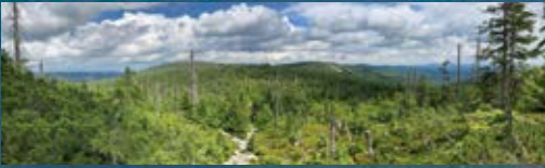
▲ ÖKOLOGISCHES GROSSPROJEKT MIT VORBILDCHARAKTER: NATIONALPARK BAYERISCHER WALD, 2022