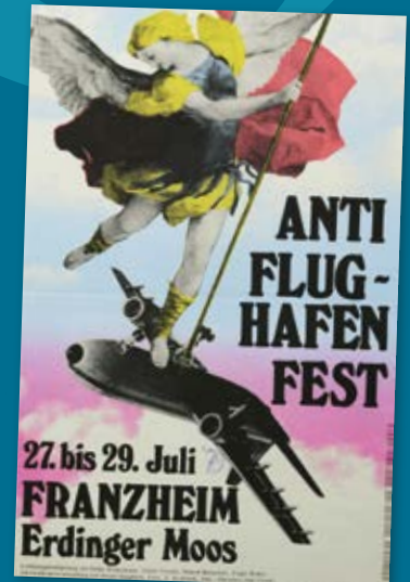
► WERBEPLAKAT FÜR DAS „ANTIFLUGHAFENFEST“ 1979, EINE PROTESTKUNDGEBUNG IM BEREITS VERLASSENEN ORT FRANZHEIM Franz Leutner, 1979; Gemeindearchiv Oberding.

WÄHREND DIE EINEN ÜBER DEN FORTSCHRITT JUBELN, KLAGEN ANDERE ÜBER DIE NATURZERSTÖRUNG. VIELES IST HEUTE NICHT MEHR WEGZUDENKEN.