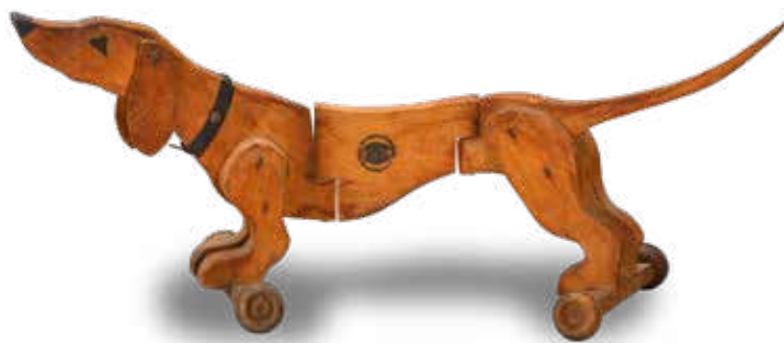
▲ HOLZDACKEL Nachzieh-Tier, 1900er-Jahre